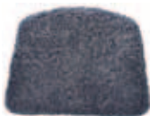
Fårull grafit 655-PR-FG