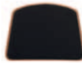
Nature svart 655-PR-18