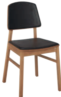
Bas ek Rygg trä+platta läder Sits trä+platta läder