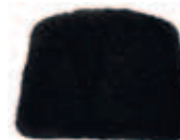
Fårull svart 655-PR-FS