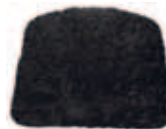
Fårull antracit 655-PR-FA