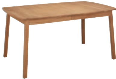
Bord ellips160(48+48)x102cm Inkl två iläggsskivor Vit, ek & svartbets