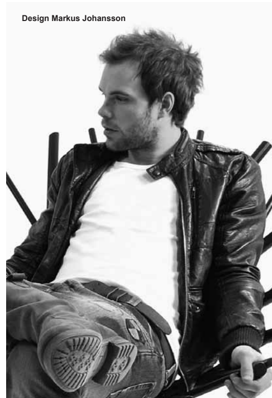
Design Markus Johansson