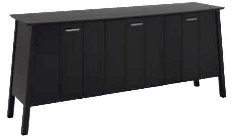
Sideboard 170cm 170x47x75cm Vit, ek & svartbets