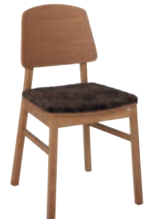
Bas ek Rygg trä Sits trä+platta fårull