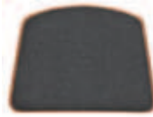
Nature grafitgrå 655-PR-182