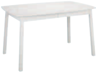
Bord ellips137(48)x90cm Inkl en iläggsskiva Vit, ek & svartbets