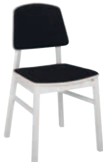
Bas vit Rygg trä+platta tyg Sits trä+platta tyg