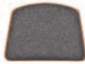
Nature grämelerad 655-PR-21