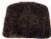
Fårull espresso 655-PR-FE