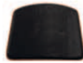
Läder svart 655-PR-BD