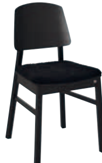
Bas svartbets Rygg trä Sits trä+platta fårull