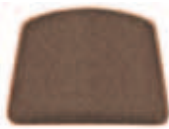
Nature brun 655-PR-16