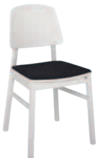
Bas vit Rygg trä Sits trä+platta tyg