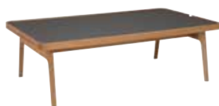
Soffbord rekt 130x75x44cm