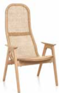
Fåtölj hög 65x70x112cm

Linoleum är en mjuk skiva i naturmaterial med matt reptålig yta. Linoleum tillverkas till största delen av naturliga material som linolja, harts, trämjöl, kalksten och jute.