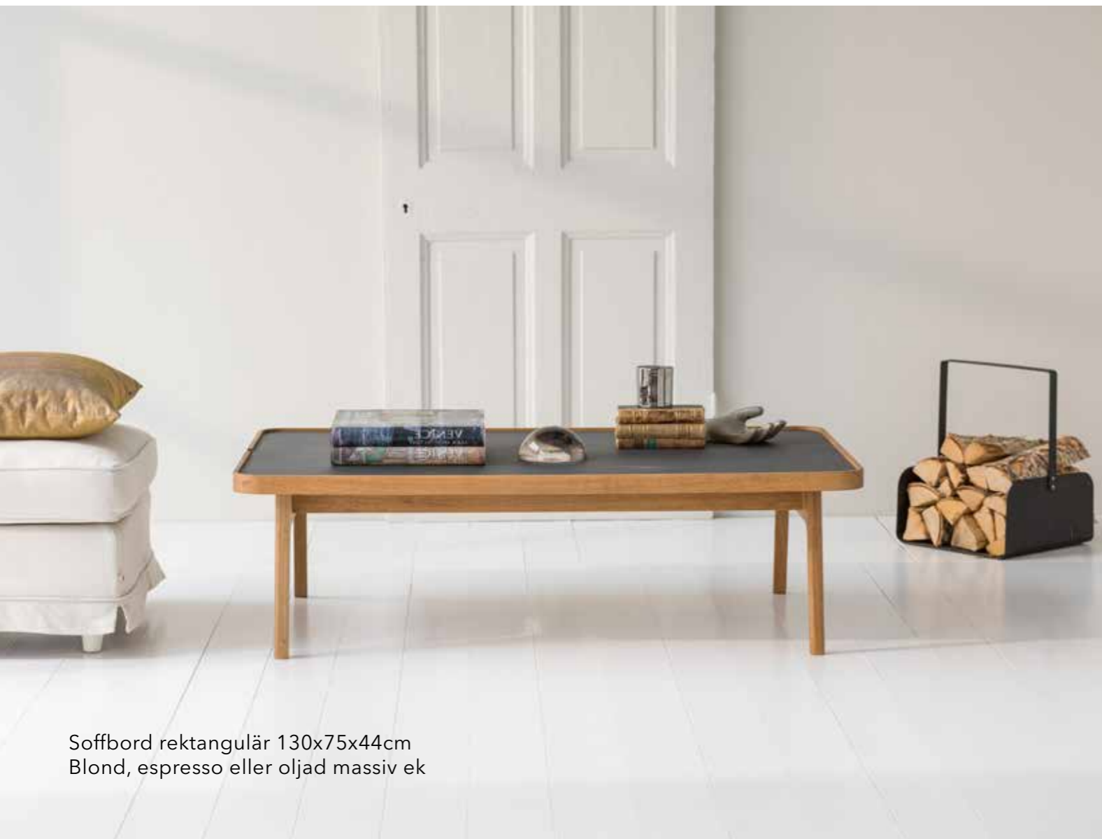
Soffbord rektangulär 130x75x44cm Blond, espresso eller oljad massiv ek