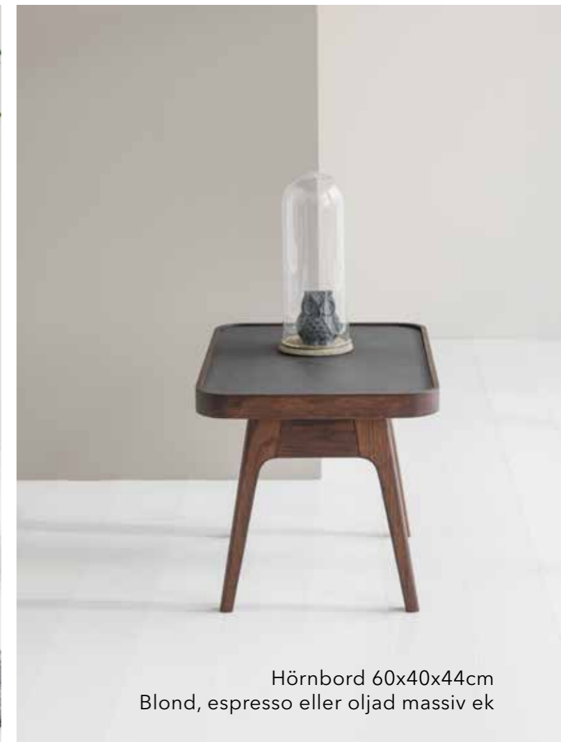
Hörnbord 60x40x44cm Blond, espresso eller oljad massiv ek