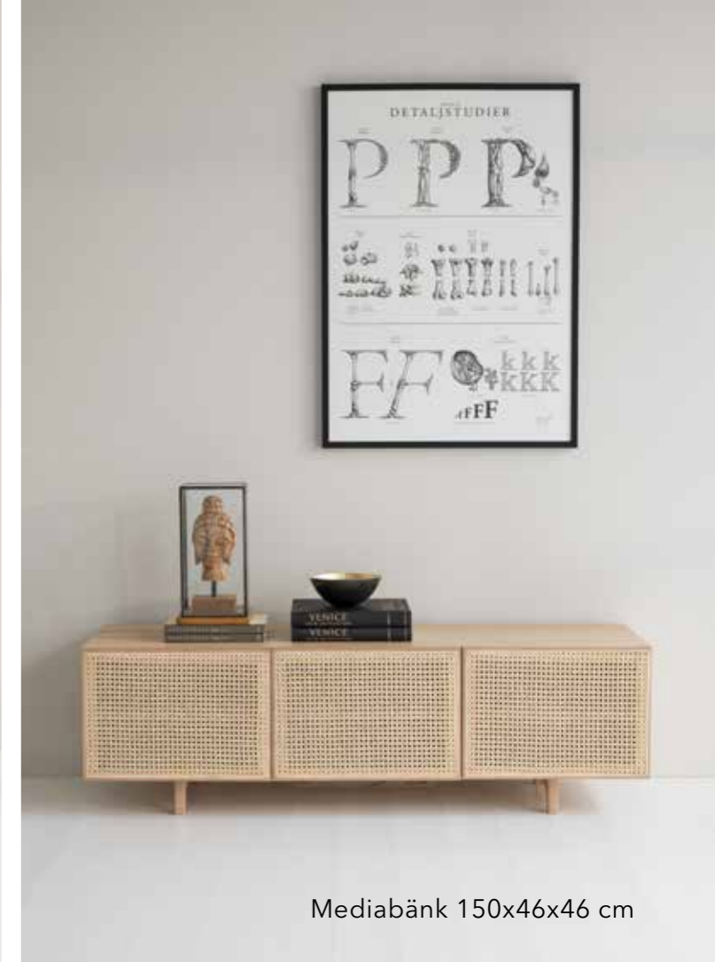
Mediabänk 150x46x46 cm