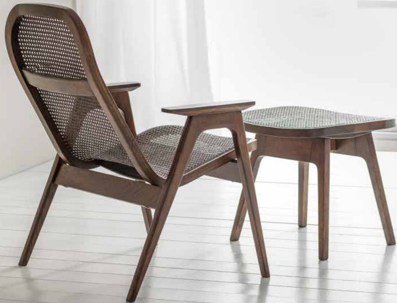
Fåtölj med fotpall Blond, espresso eller oljad massiv ek

Rotting är något av ett modernistiskt material. Inte nostalgiskt tillbakablickande utan istället en dröm om framtiden. Dess solljusfiltrerande transparens och komfortabla svikt står i stark kontrast mot den kraftiga ramen i massivt trä. Precis som en gammal racket. Fåtöljernas elastiska ryggstolar är lätt tillbakalutad, men ramen och dess tydligt horisontella armstöd är desto mer bestämt. Här möts det nordiska naturromantiska med österländsk tradition. Starkt och fast, och samtidigt med en lätt och mjukt formad linjeföring.