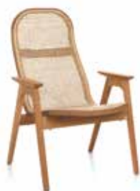
Fåtölj låg 65x70x95cm