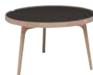
Soffbord runt 80cm 80x80x48