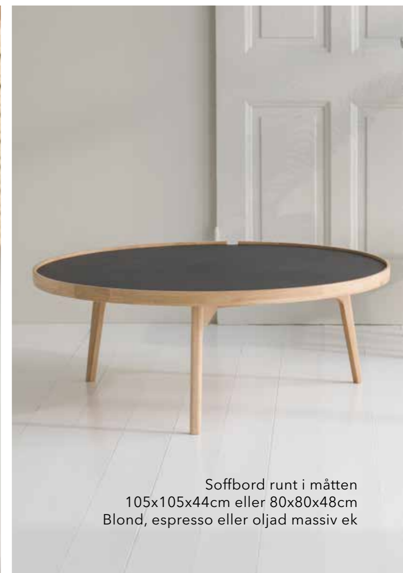
Soffbord runt i måtten 105x105x44cm eller 80x80x48cm Blond, espresso eller oljad massiv ek