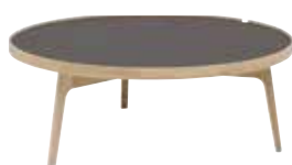
Soffbord runt 105cm 105x105x44